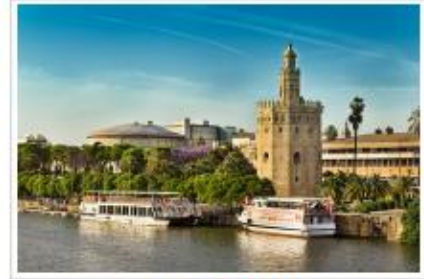
Torre del Oro

El clima de Sevilla es generalmente húmedo y templado. En verano hace mucho calor e incluso se llegan a los 50°. Los inviernos son suaves y llueve con frecuencia. A Sevilla se puede llegar en tren, barco, autobús, coche o avión. Sevilla tiene un aeropuerto y tres universidades.